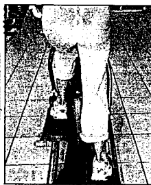
Raymond Wae-Ton Dans les rayons remise en forme, les appareils « cardio » comme les elliptiques sont très tendance.

A l'instar des centres, le matériel de remise en forme connaît un succès certain auprès de la clientèle, parfois la même qui fréquente ces structures : « Ceux qui viennent acheter des vélos sont généralement inscrits dans des centres, ou en tout cas sont des gens qui font du sport », estime Leyla. Si le vélo demeure l'un des accessoires « phare » de l'équipement individuel, la tendance du moment est à l'« elliptique »,